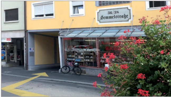
Eingang zur Praxis über den Hof Semmelstrasse 36/38