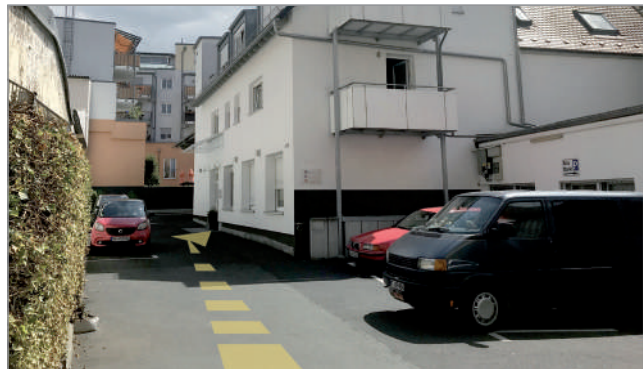
Unser Praxisgebäude – Parkplätze links an der Mauer