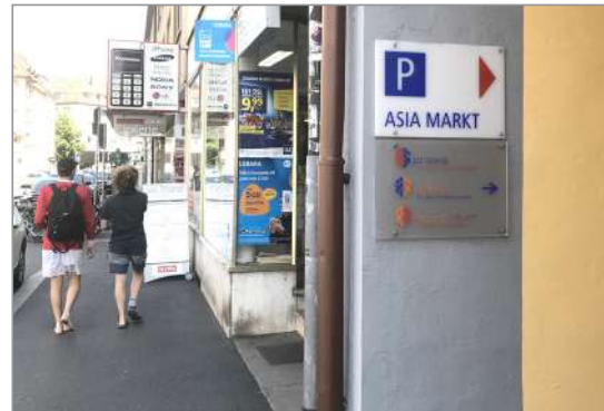
Eingang zur Praxis über den Hof Semmelstrasse 36/38